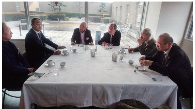
クラブフォーラムの様子 テーマ「私のクラブでやってみたいこと やりたいこと あれこれ」